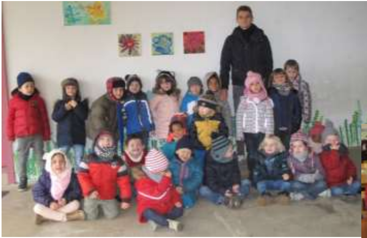
← Classe de FAILLY – Maternelles M. LANG

Cette année, les élèves du regroupement pédagogique sont répartis entre 4 écoles : 45 élèves en maternelle sont à Faily répartis dans 2 classes, 17 élèves de CP et 7 élèves de CE1 sont à Malroy, 12 élèves de CE1 et 16 élèves de CE2 sont à Vany, 12 élèves de CM1 et 16 élèves de CM2 sont à Servigny-lès-Sainte-Barbe.