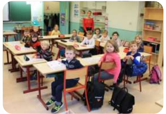
Classe de CP à Malroy 2018