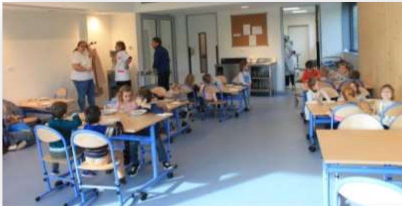
CANTINE : 1 er service pour les maternelles