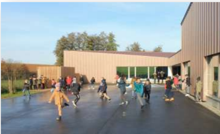
C'est la récréation de l'élémentaire