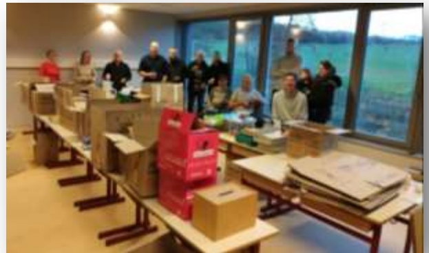
22/12/2018 : emménagement à Vany dans la nouvelle classe