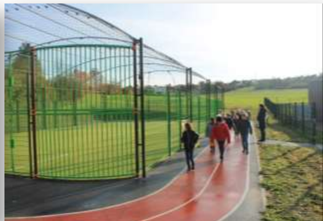
CITY STADE de Vany mis à disposition pour les activités sportives